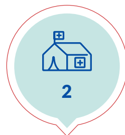
Hospitales de Campaña