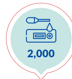
Kits de Testeo