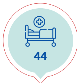
Camas de Hospital