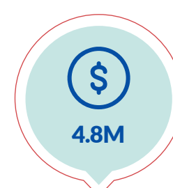
Ayuda Total (USD)