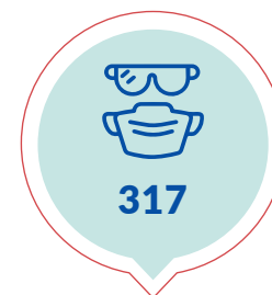
Kits de EPP